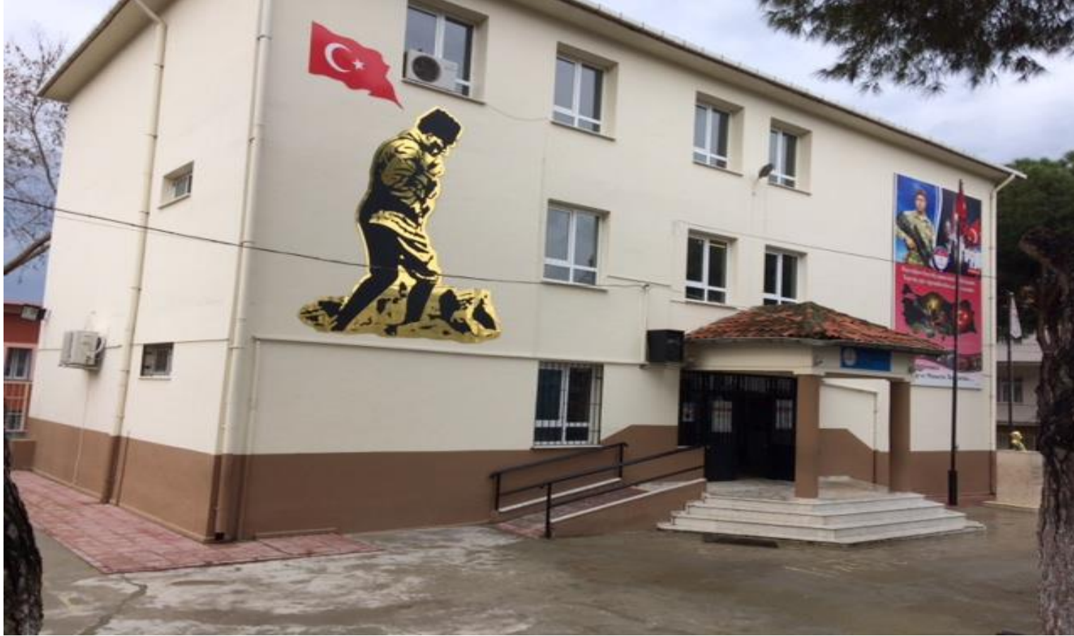
80. Yıl Cumhuriyet İlkokulu